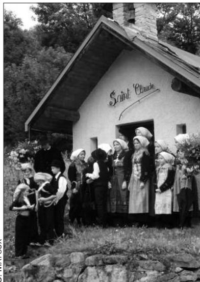
■ Une partie des personnes costumées devant la chapelle Saint-Claude.