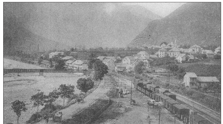
■ Saint-Avre, le pont sur l'Arc et la gare (carte postale ancienne).

(*) Pont, aujourd'hui disparu, qui enjambait l'Arc au Chaney, sur la commune de Sainte-Marie-de-Cuines, au droit du tunnel ferroviaire situé rive droite de l'Arc entre Saint-Avre et Saint-Jean-de-Maurienne.